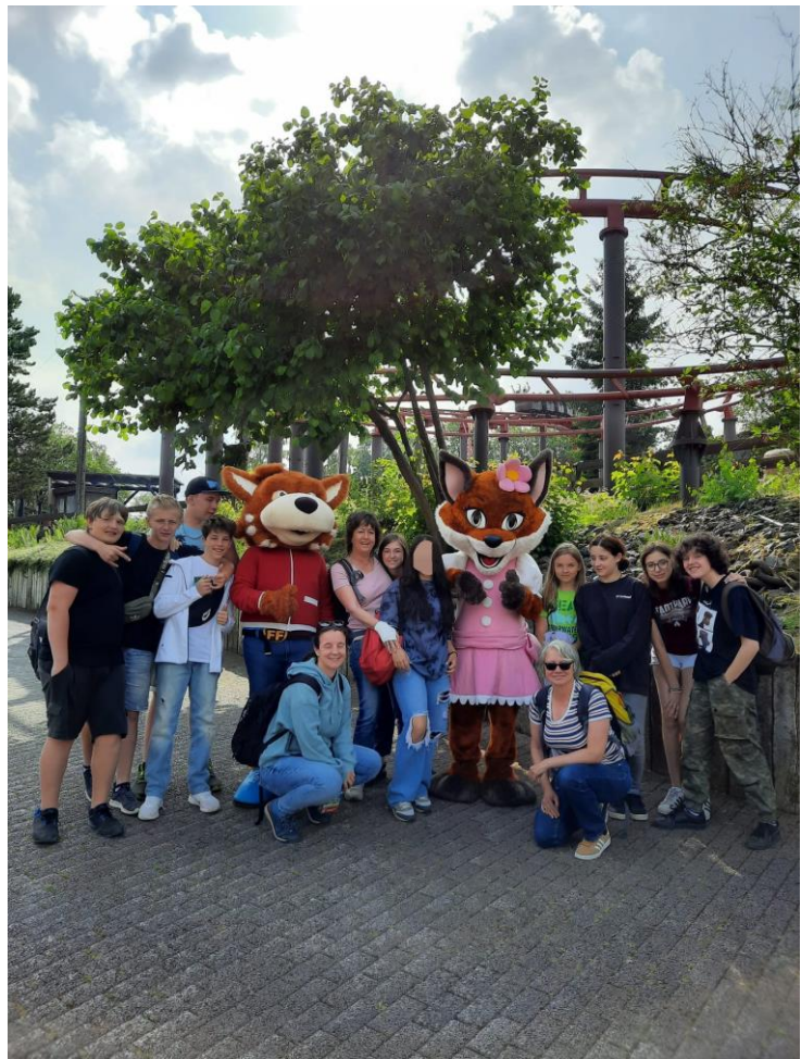
Ausflug in den Freizeitpark Fort-Fun in den Sommerferien – „Alle“ hatten Spaß