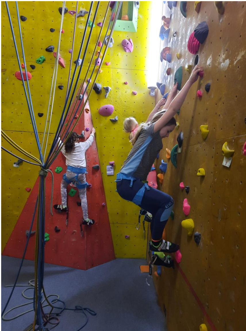
Kletterfreizeit in den Osterferien